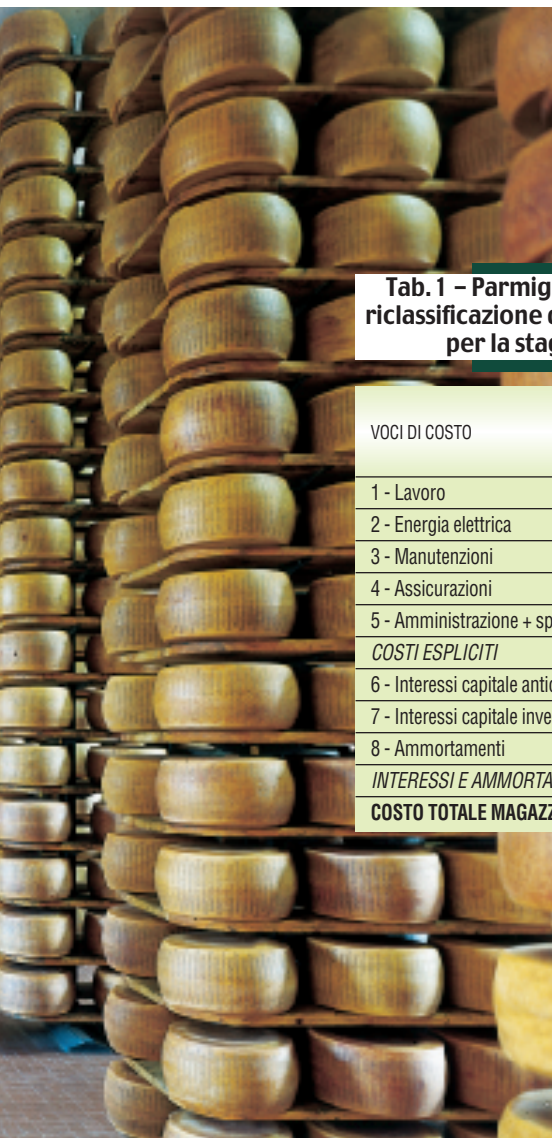
Tab. 1 – Parmigiano-Reggiano: riclassificazione delle voci di costo per la stagionatura.