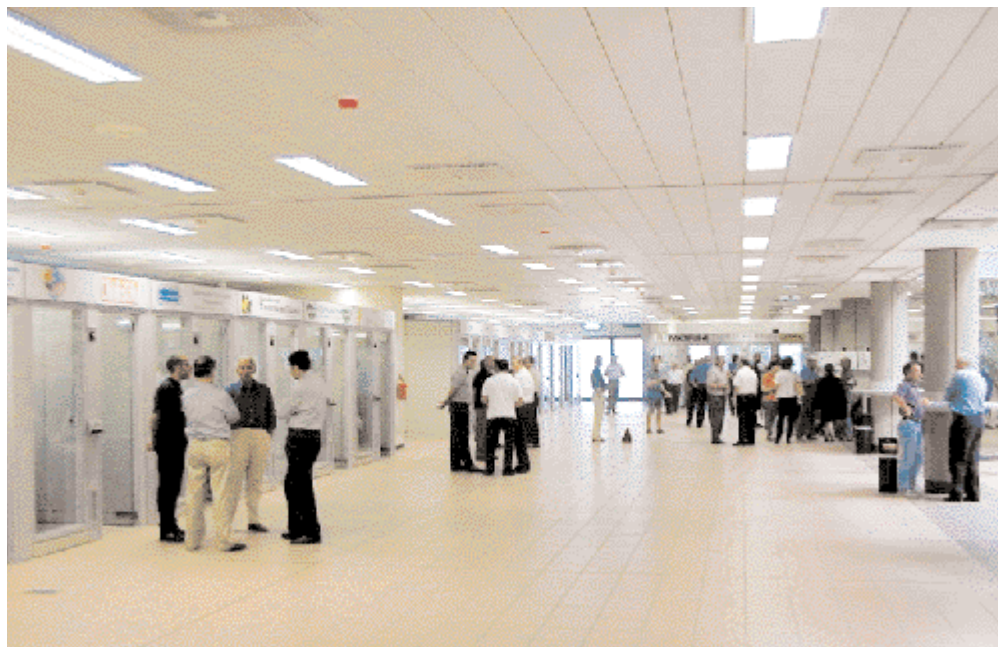
Due immagini della Sala contrattazioni del Mercato avicolo di Forlì, presso la quale sarà realizzato il Centro servizi per le imprese avicunicole.

Il Centro, avvalendosi anche dei servizi già erogati dalla Sala contrattazioni del Mercato avicunicolo del Comune di Forlì e dall'Aerac, si articolerà