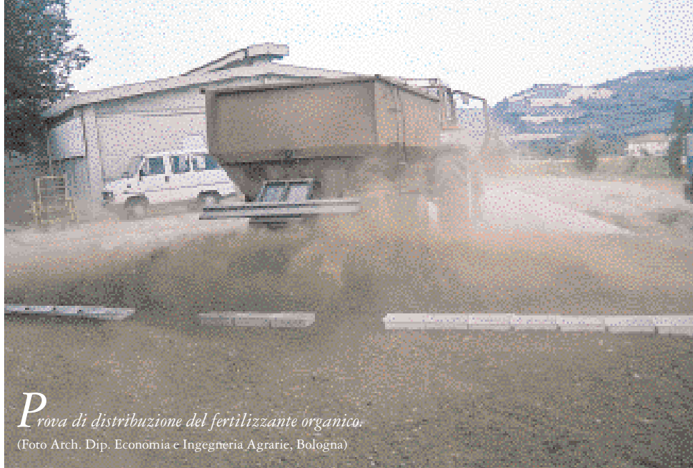
Prova di distribuzione del fertilizzante organico.

L'uniformità dello spandimento è stata valutata utilizzando una serie di contenitori disposti trasversalmente alla direzione di avanzamento; pesando il prodotto raccolto è stato definito il coefficiente di variabilità trasversale ( CV_{\perp} ). Analogamente, con i campioni raccolti lungo la direzione di avanzamento è stato possibile valutare la qualità del lavoro attraverso il coefficiente di variabilità longitudinale ( CV_{\parallel} ). Nel caso dei concimi chimici, i valori dei coef-