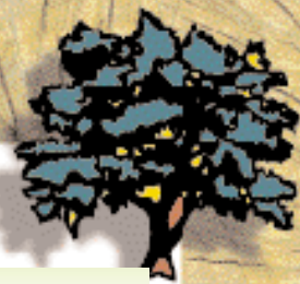
Tab. 1 – Difesa integrata del pioppo.