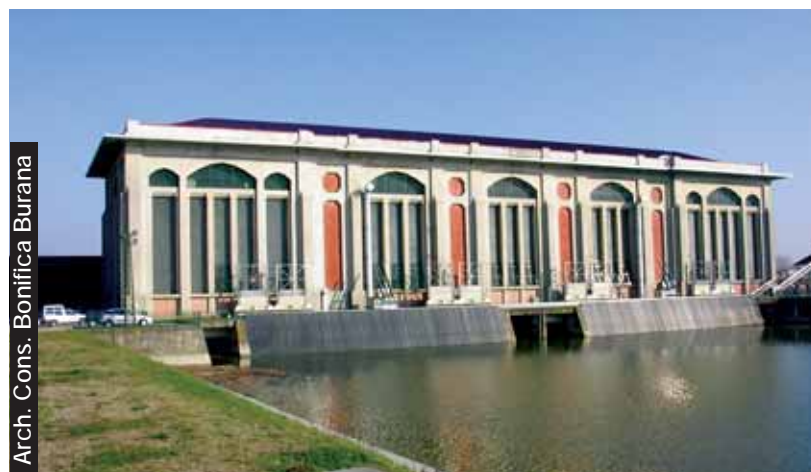
Arch. Cons. Bonifica Burana