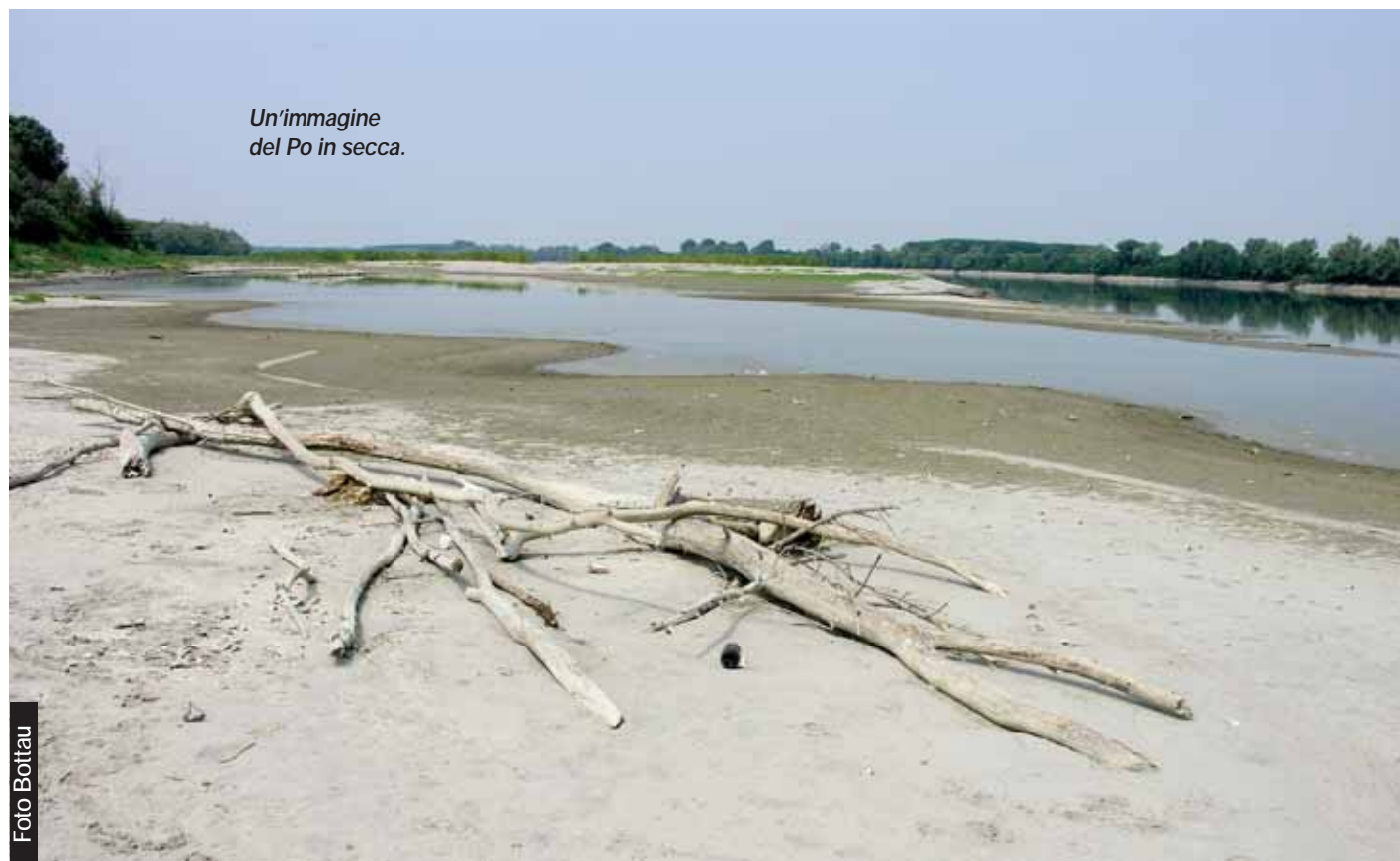
Un'immagine del Po in secca.

Tutto ciò provoca un deciso aumento dei fabbisogni d'acqua delle colture, rendendo l'irrigazione sempre più imprescindibile e assolutamente necessaria per raggiungere buoni standard produttivi. L'andamento delle precipitazioni negli ultimi decenni mostra due aspetti molto preoccupanti: la diminuzione delle piogge totali, in atto dagli anni '80, e la diminuzione della frazione d'acqua piovana che si infiltra nel terreno e rimane a disposizione delle piante. Il trend delle temperature massime mostra un chiaro incremento di quasi 2° C in poco più di 40 anni, con un'impennata dall'inizio degli