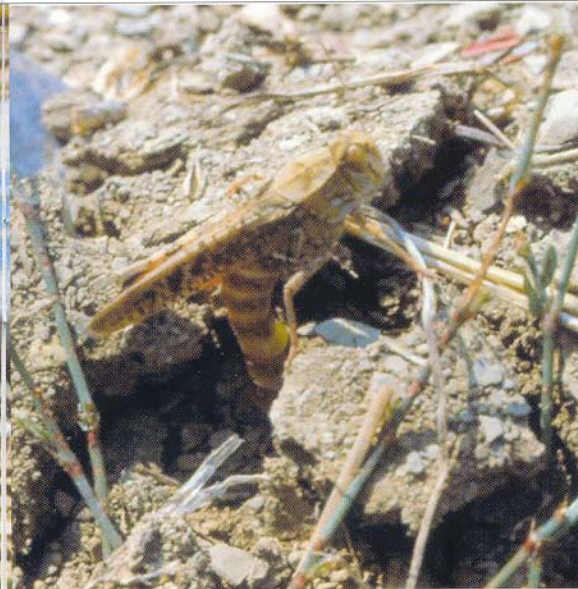
In copertina, adulto di Calliptamus italicus . A sinistra, le femmine adulte privilegiano nella scelta dei luoghi di ovodeposizione terreni con assenza di ristagno idrico.